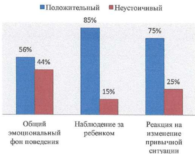
Результаты на начало года